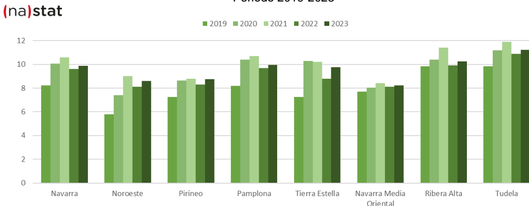
Evolución de las Tasas de paro por zonas según zonificación Navarra 2000 Periodo 2019-2023